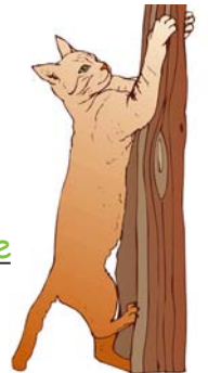
arbre à chat

• Essaie de répondre aux questions suivantes :