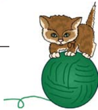
pelote de laine