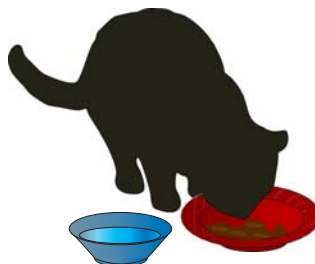
endroit pour aliments