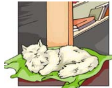
endroit pour dormir