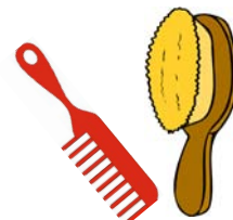
brosse et peigne