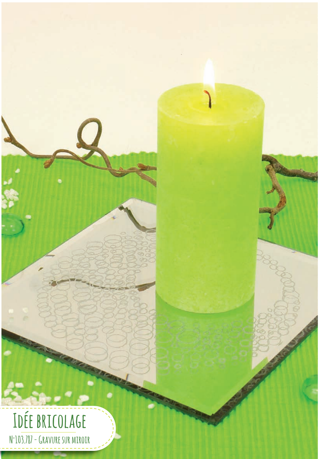
IDÉE BRICOLAGE N°103.787 - GRAVURE SUR MIROIR

Pour finir, nettoyer le miroir avec un chiffon doux.