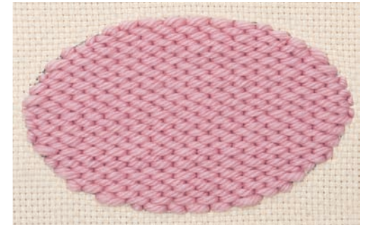
♥ Plattstich gerade und im Fadenlauf gestickt. Hier wird versetzt und über 4 Quadrate gearbeitet. Es ergibt sich eine Oberfläche, die wie gewebt aussieht.