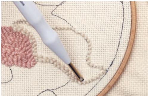
♥ Schlaufen - Stickbeginn auf der Rückseite.

Gleich wie vorhin, beginnt man auch hier wieder mit der Kontur und puncht anschließend die Flächen mit unterschiedlich langen Stichen. Gerne wird in Runden mit versetzten Stichen gestickt (max. 1,5 cm). Man sollte immer darauf achten, dass die Stiche dicht zusammengearbeitet werden. Möchte man nicht in Runden stricken, kann der Plattstich natürlich auch gerade in Zeilen gepunzt werden.