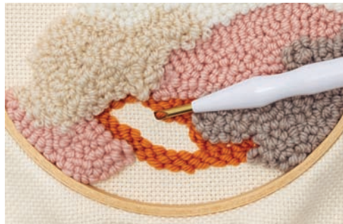
♥ Plattstich - Stickbeginn auf der Vorderseite.