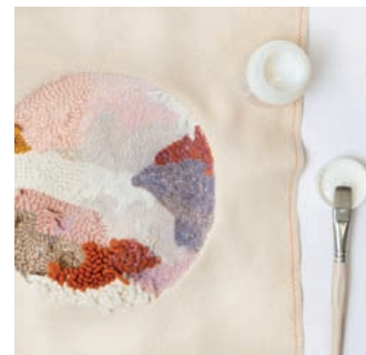
♥ Den Kleber mit einem Holzstäbchen umrühren, mit einem Pinsel auftragen und 1 - 2 h trocknen lassen.