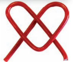
das überflüssige Stk. abschneiden