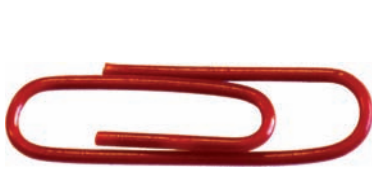
1 runde Büroklammer